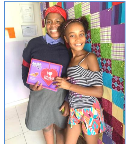
Freude über schöne Patchworkdecke aus Regensburg und Milka-Schoki!