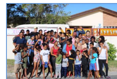
Die große Elonwabeni-family sagt Dankeschön!