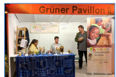
Die KinderAIDShilfe Freunde München mit ihrem Stand beim Sommer Tollwood Festival 2019