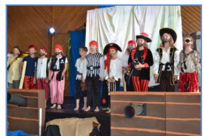
SchülerInnen der GS Althenthann bei ihrer Musicalaufführung im Juli - mit einem Spendenerlös von 500 €!